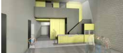
Investeren in lokale verenigingen p. 2