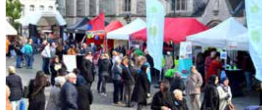
Temse Kleurt was succes p. 3