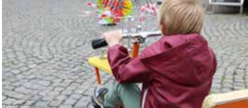
Geslaagde duurzame mobiliteitsdag p. 2 en 3