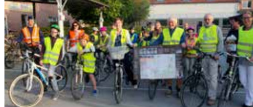
Schoolroutekaart toont veiligste fietstrajecten p. 3