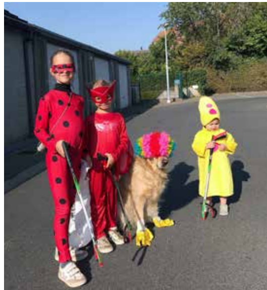
► Onze lokale helden haalden in totaal zo'n 2.500 kilogram zwerfvuil op.